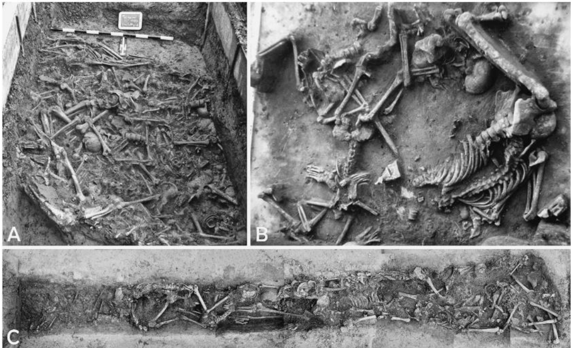
Figura 3. Exemples de fosses comunes resultants de massacres a LBK (Neolític antic centre Europeu). A: Talheim (Baden-Württemberg). after Price et al. 2006, 263. B: Wiederstedt (Sachsen-Anhalt). after Meyer et al. 2004, 32. C: Kilianstädten, (Hessen) Arrangement: C. Lohr.

D'això podem concloure que el sexe era una variable important a l'hora de rebre i infligir violència interpersonal i que la capacitat productiva i reproductiva de les dones era un recurs preuat i buscat.