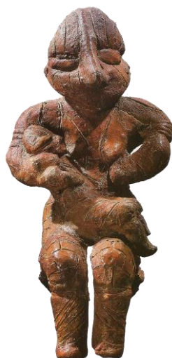
Figura 1. Figurina d'una dona amb un bebè als braços. Jaciment arqueològic de Drenovac. Museu regional de Jagodina (ERC BIRTH project, BioSense Institute). https://sketchfab.com/3d-models/figurine-of-a-woman-with-a-baby-in-arms-fc089942ff5c4a3fb882778aab934ef4

Barcelona, 21 de juliol de 2020 4 minuts